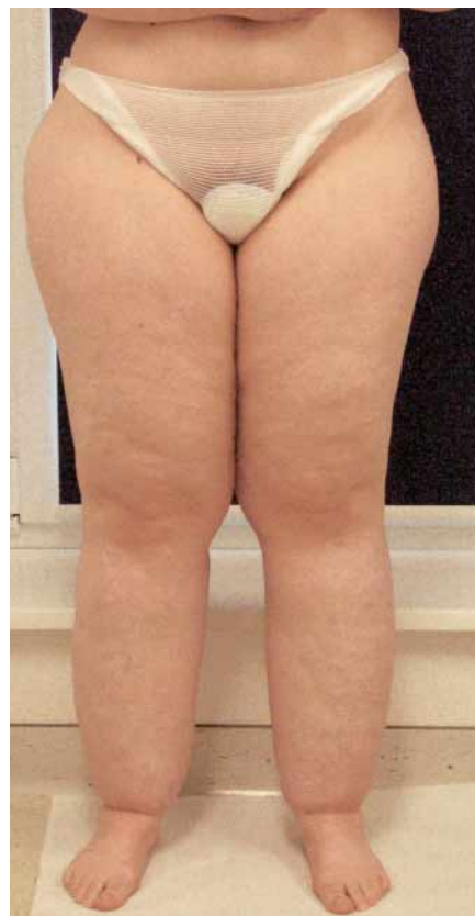
Abb. 1 Patientin mit deutlichem Lipödem der Beine an Unter- und Oberschenkeln.

Das Lipödem ist demnach im weiteren Sinne ein lymphologisches Krankheitsbild. Zur Unterscheidung von Lipödem und Lipohyperplasie/Lipohypertrophie siehe auch die Leitlinie der DGP (17).