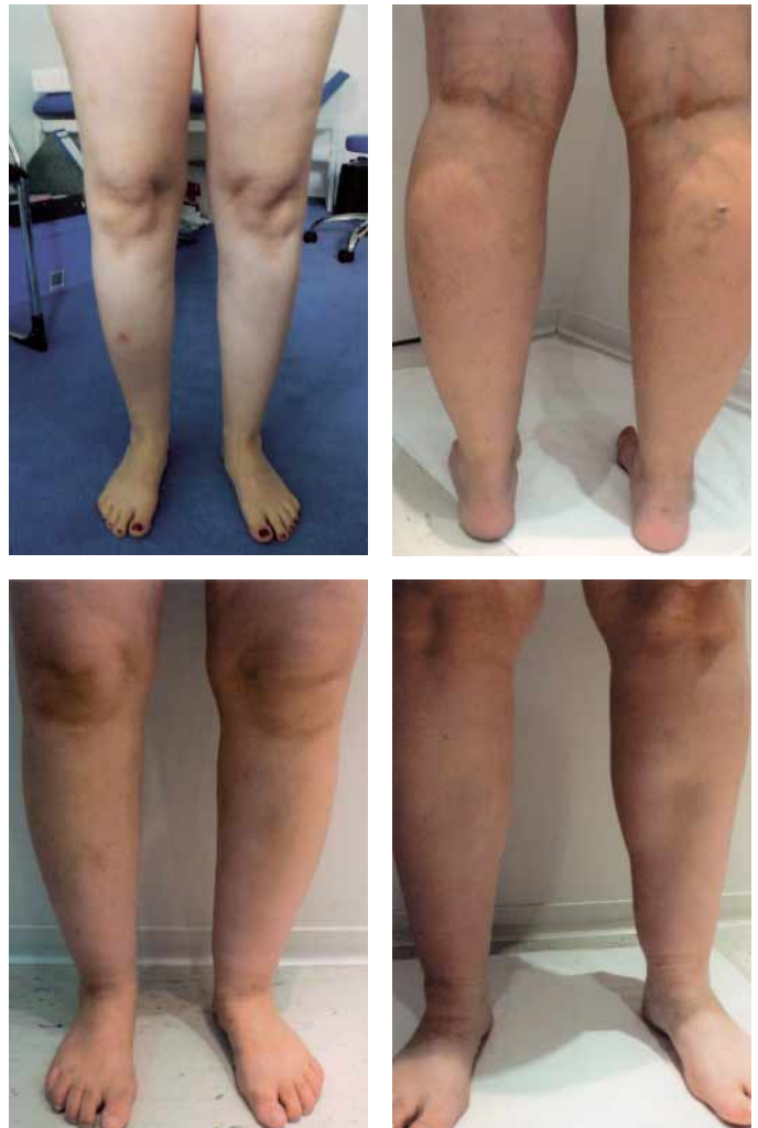
Abb. 2 Patientinnen mit unterschenkelbetontem Lipödem.

Echolose Spalten und Kanäle in der Subkutis (Längsausrichtung im Fesselbereich); Verbreiterung (und Auflockerung) der Kutis (>2,4 mm) (nicht obligat beim Lipo-Lymphödem).